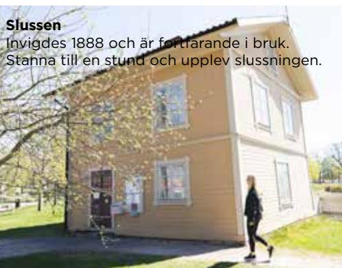
Slussen Invides 1888 och är fortfarande i bruk. Stanna till en stund och upplev slussningen.