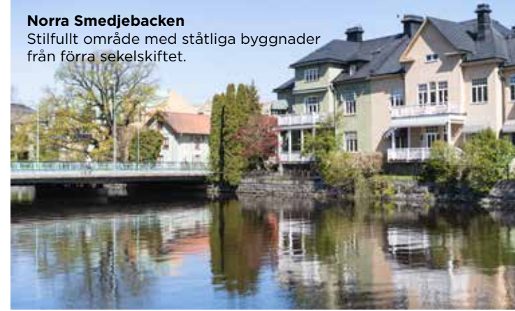
Norra Smedjebacken Stilfullt område med ståtliga byggnader från förra sekelskiftet.