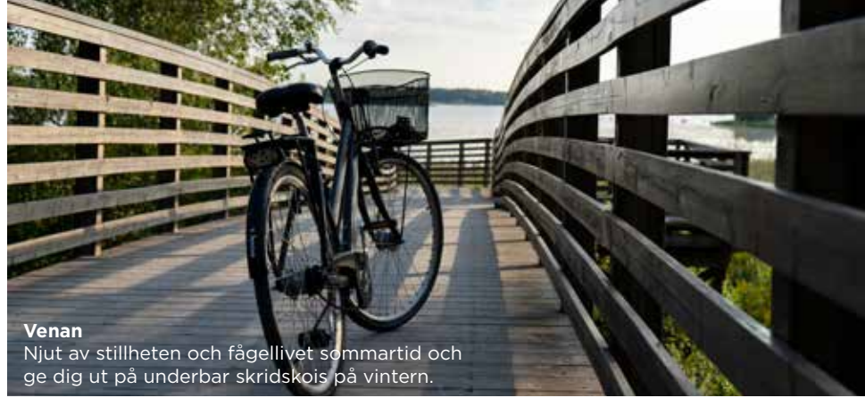
Venan Njut av stillheten och fågellivet sommartid och ge dig ut på underbar skridskois på vintern.