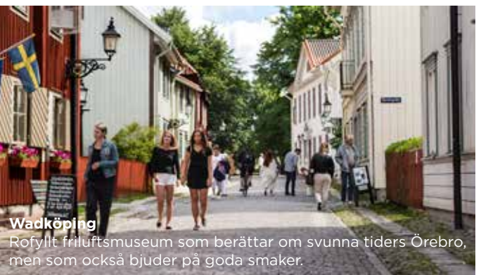
Wadköping Rofyllt friluftsmuseum som berättar om svunna tiders Örebro, men som också bjuder på goda smaker.