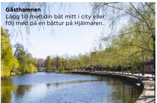
Gästhamnen Lägg till med din båt mitt i city eller följ med på en båttur på Hjälmarens.