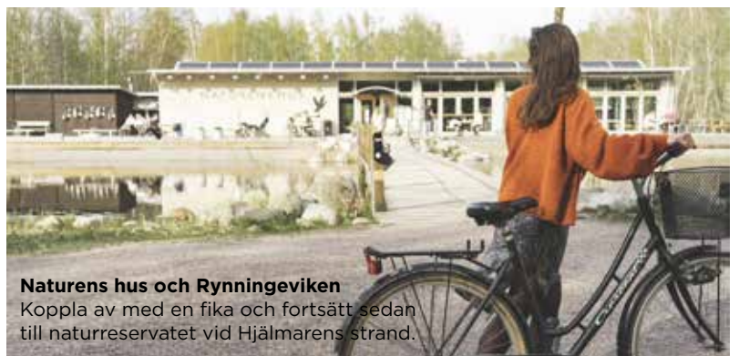
Naturens hus och Rynningeviken Koppla av med en fika och fortsätt sedan till naturreservatet vid Hjälmarens strand.