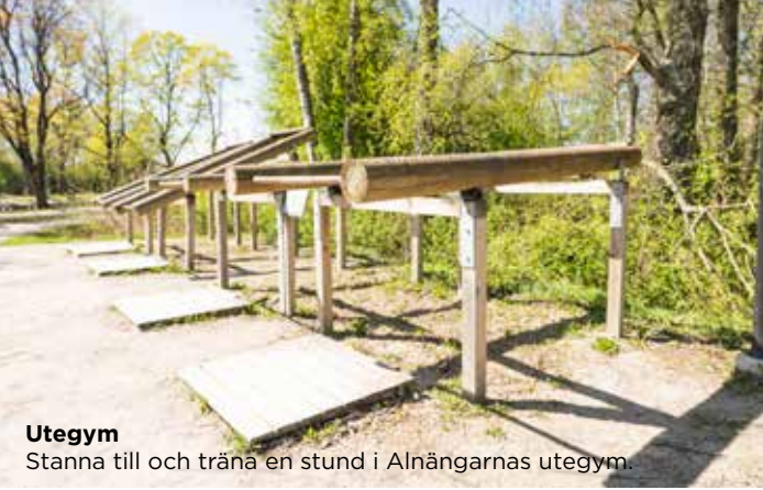
Utegy Stanna till och träna en stund i Alnängarnas utegy.