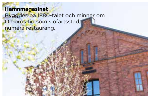
Hamnmagasinet Byggdes på 1880-talet och minner om Örebros tid som sjöfartsstad, numera restaurang.