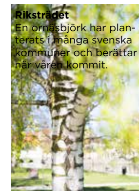
Riksträdet En ornäsbjörk har planterats i många svenska kommuner och berättar när våren kommit.