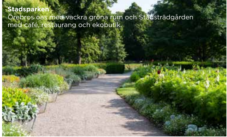
Stadsparken Örebros oas med vackra gröna rum och Stadsträdgården med café, restaurang och ekobutik.